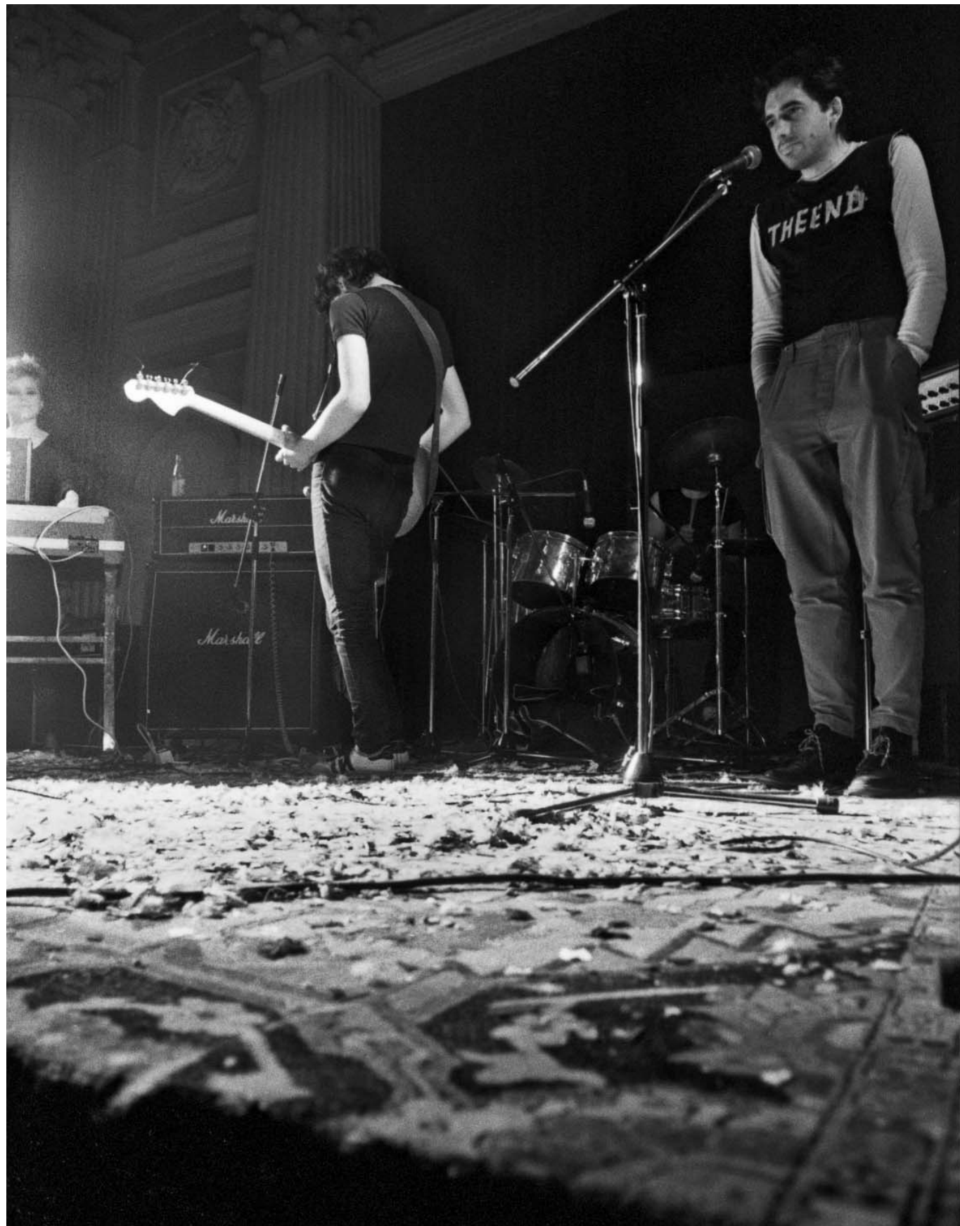
Luna, SKC