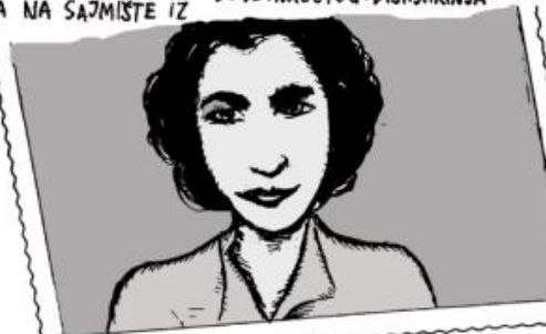
JEVREJSKE BOLNICE, GDE SE BAVILA VOLONTERSKIM RADOM...